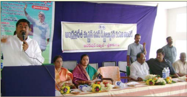
శ్రీకాకుళం సర్కిల్ కార్యాలయాన్ని ప్రారంభిస్తున్న రాష్ట్ర మంత్రి దర్బాన ప్రసాదరావు స్థానిక ప్రజాప్రతినిధులు.

ఏపీఈపీడిసీఎల్ సర్కిల్ కార్యాలయాలను కార్పొరేట్ లుక్ తో నిర్మించారు. శ్రీకాకుళం, విజయనగరం సర్కిల్ కార్యాలయాలు విశాలమైన గదులు, సమావేశ మందిరాలతో నిర్మించారు. సర్కిల్ కార్యాలయాలను స్థానిక మంత్రులు ప్రారంభించారు.