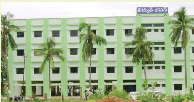
విజయనగరం సర్కిల్ కార్యాలయాన్ని ప్రారంభిస్తున్న రాష్ట్ర మంత్రి బొత్తు సత్యన్నారాయణ, స్థానిక ప్రజాప్రతినిధులు